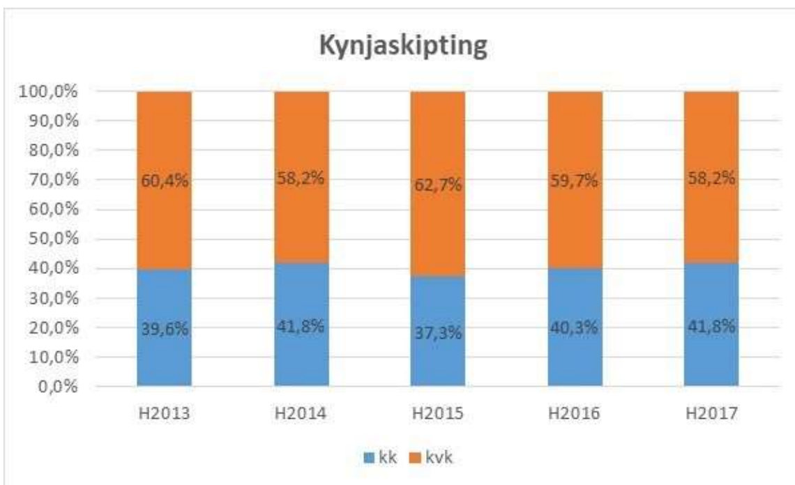
Mynd 1 Skipting dagskólanemenda eftir kyni.

Skipting milli kynja hefur verið svipuð á síðustu árum og eru konur í dagskólanum í miklum meirihluta.